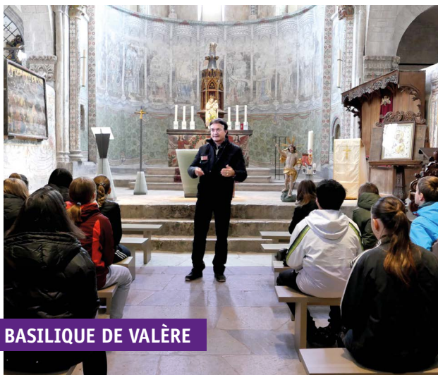
BASILIQUE DE VALÈRE

Résonances a opté pour une découverte traversante, de façon à vous donner un aperçu du programme, en évoquant une activité par lieu (alors qu'il y en avait deux à chaque étape). Cette visite partielle est descendante, du château de Valère, sis sur la colline opposée à Tourbillon, aux sous-sols des archives. L'objectif était aussi d'illustrer chacun des lieux de visites.