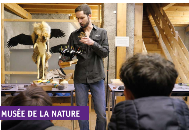
MUSÉE DE LA NATURE

A l'Ancien Pénitencier, actuellement en travaux, les élèves pénètrent dans la salle des stèles et se familiarisent avec l'histoire de la nécropole du Petit Chasseur . Les ados ressortent avec des explications sur les privilèges funéraires des élites.