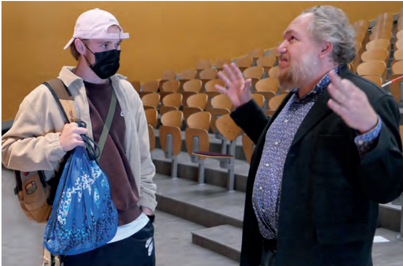
Quelques étudiants sont restés à la fin de la rencontre pour dialoguer avec l'écrivain, notamment pour évoquer l'inspiration artistique.