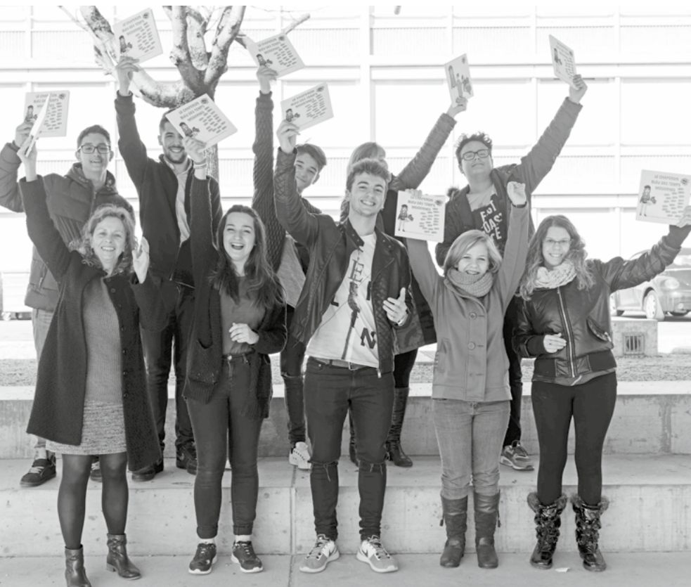
Les élèves et les enseignantes en promotion