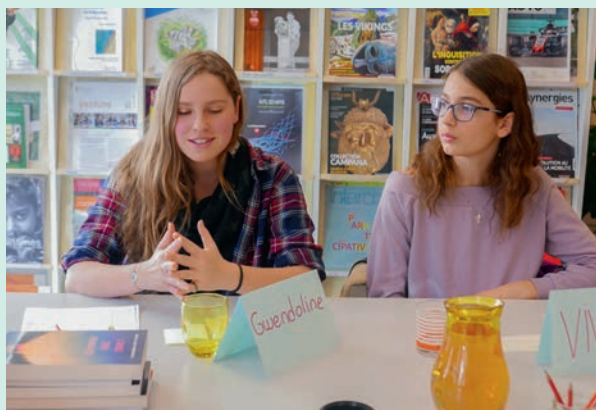
Prix RTS Littérature Ados, deux membres du jury valaisan