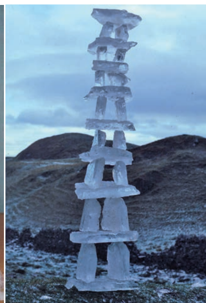
Différentes réalisations à faire dans le cadre des AC&M - Œuvre d'Andy Goldworthy