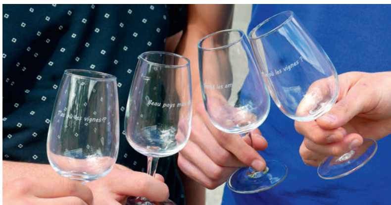
«GravVerre», des verres gravés avec «des citations de notre terre»